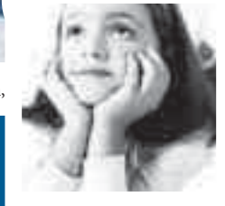
Ich habe Lust, Schneeburgen zu erobern, es mit den Herausforderungen der Rodelbahnen von Les Menuires aufzunehmen,