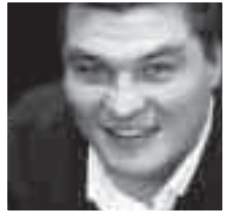
Hier bei diesen Festen, die mich in eine bunte, farbenfrohe Welt mit Musik und Feuerwerk versetzen, schlägt das Herz von Les Menuires!